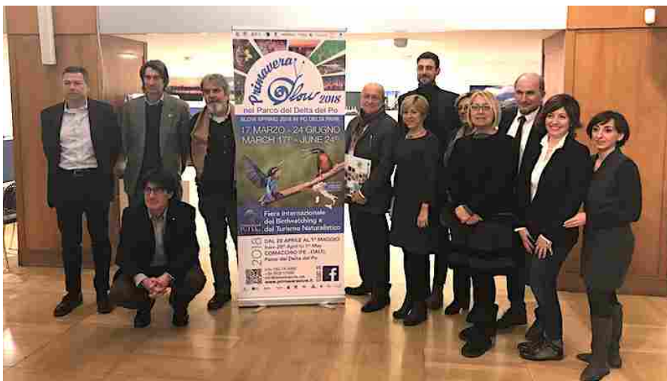
In foto un momento della presentazione a Milano di "Primavera Slow nel Parco del Delta del Po"