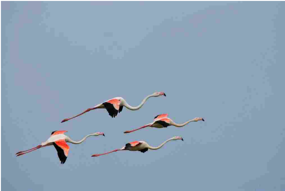
Fenicotteri in volo

Anche in barca il divertimento è assicurato. “Dove il fiume incontra il mare”, porta a alla scoperta dei rami fluviali di Goro e Gnocca dalle lunghe isole sabbiose. Con “Un viaggio nel silenzio della Foce” si esplora, invece, la Sacca di Goro. Si scopriranno gli impianti di vongole e cozze spingendosi sino all’Isola dei gabbiani. E per riscoprire il contatto più autentico con la natura sono previste anche numerose escursioni a cavallo . Passeggiate adatte a tutti, grazie alla docilità e mansuetudine dei cavalli di Razza Delta. Sagre ed eventi gastronomici permetteranno di scoprire i sapori ricchi di tradizione del Parco. Mentre le visite guidate alla scoperta dei siti storici ripercorrono il lungo rapporto tra l’uomo e il territorio. Da non perdere quelle all’antica delizia estense del Verginese, o quella alla necropoli romana dei Fadieni .