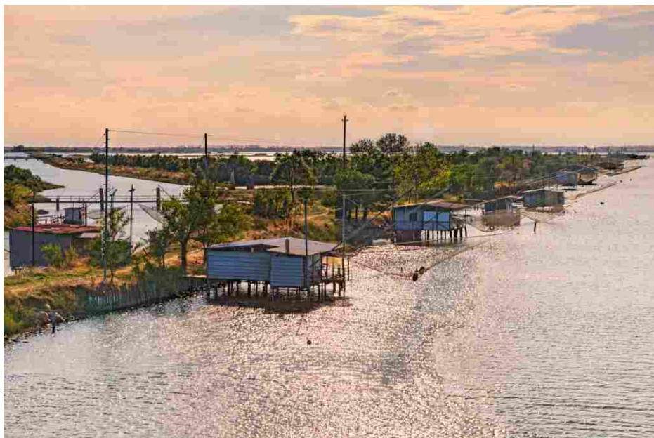
Delta del Po

Il ricco calendario di eventi della kermesse primaverile permetterà proprio a tutti di godere della bellezza del Parco. Attività per tutti i gusti e tutte le età valorizzeranno un territorio estremamente ricco di attrattive. Località come Comacchio, Goro, Rosolina, Mesola e Ravenna sfoggiano scorci in cui storia e natura si fondono alla perfezione. Dalla costa all'entroterra, non c'è luogo del Parco del Delta del Po che non offra numerosi spunti per piacevoli passeggiate ed escursioni. Dalle Valli di Argenta , all' Oasi di Bando , alle Vallette di Ostellato sino ai territori della Bassa Romagna . Ad ogni luogo verrà resa giustizia dalle iniziative di Primavera Slow. Non è un caso, in fondo, se dal 2015 il Parco è stato dichiarato Riserva della Biosfera MaB UNESCO . Tra laboratori didattici, visite guidate, escursioni, tutta la famiglia sperimenterà il piacere di trascorrere la primavera in mezzo alla natura.