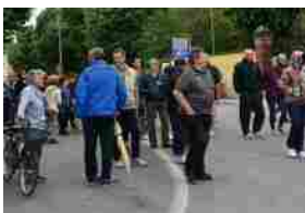
Passeggiata di primavera