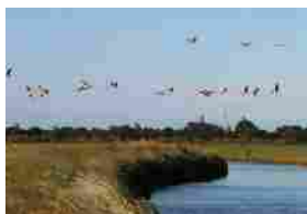
Primavera Slow 2018 sul delta del Po