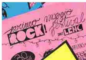
Primo maggio Rock! Festival