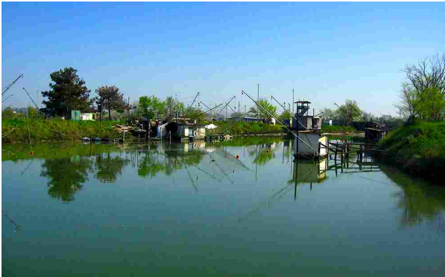
Bellissimo delta del Po

L'evento, che vanta nelle passate edizioni una media di 30.000 visitatori e circa 200 espositori, si svolge in un territorio che si conferma quale meta privilegiata per praticare birdwatching e un turismo "lento" a contatto con la natura.