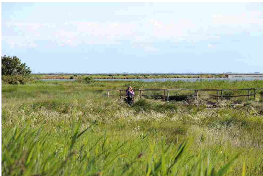
Valle Campo

Un altro appuntamento imperdibile è la Fiera Internazionale del Birdwatching e del Turismo Naturalistico a Comacchio , la cui 9° edizione si svolge dal 28 aprile al 1° maggio, per tutti gli amanti della fotografia naturalistica e dell'osservazione dell'avifauna.