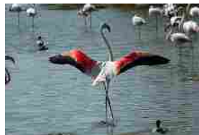
Parco del Delta, patrimonio UNESCO