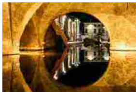
Luci e presepi sul Delta del Po