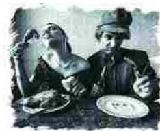
Mangiafexpo, a Ferrara si mangia in piazza