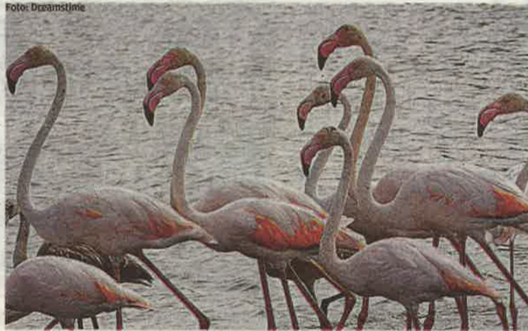
APPUNTAMENTO IMMANCABILE - Dal 28 aprile al 1º maggio

La Fiera internazionale del birdwatching e del turismo naturalistico a Comacchio nel Parco del Delta del Po Emilia Romagna è un appuntamento da non perdere per gli amanti della fotografia naturalistica e dell'osservazione dell'avifauna e del turismo lento. Si tratta infatti dell'unico Country event specializzato in cui, oltre a incontrare le aziende, provare le attrezzature sul campo e scoprire offerte sulle mete turistiche naturalistiche internazionali, i visitatori possono muoversi proprio nel cuore del Parco del Delta del Po Emilia Romagna. Qui, dal 28 aprile al primo maggio 2018, scoprono un inestimabile patrimonio naturalistico a piedi, barca, in bicicletta approfittando delle tante iniziative organizzate a corollario dell'area espositiva. Tra le iniziative organizzate ci sono workshop fotografici, concorsi per fotografia e documentari ambientali,