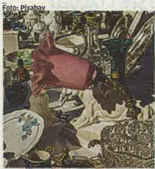
LA 1ª DOMENICA - Di ogni mese

Per aderire alle nostre iniziative e comunicare sui nostri speciali contatta il numero 051 6033848 o scrivi a spe.bologna@speweb.it Visita gli speciali on line sul sito www.ilrestodelcarlino.it