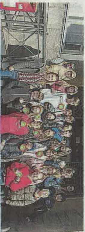
I ragazzi dell'Isc in visita ieri al municipio di Comacchio

zioni degli organi politici ed amministrativi negli enti locali. Da parte del Comune di Comacchio va un grazie ai ragazzi dell'Istituto Comprensivo di Comacchio e Porto Garibaldi che, con attenzione e serietà hanno preso molto seriamente il loro impegno in Consiglio Comunale, un buon inizio per i cittadini del futuro.